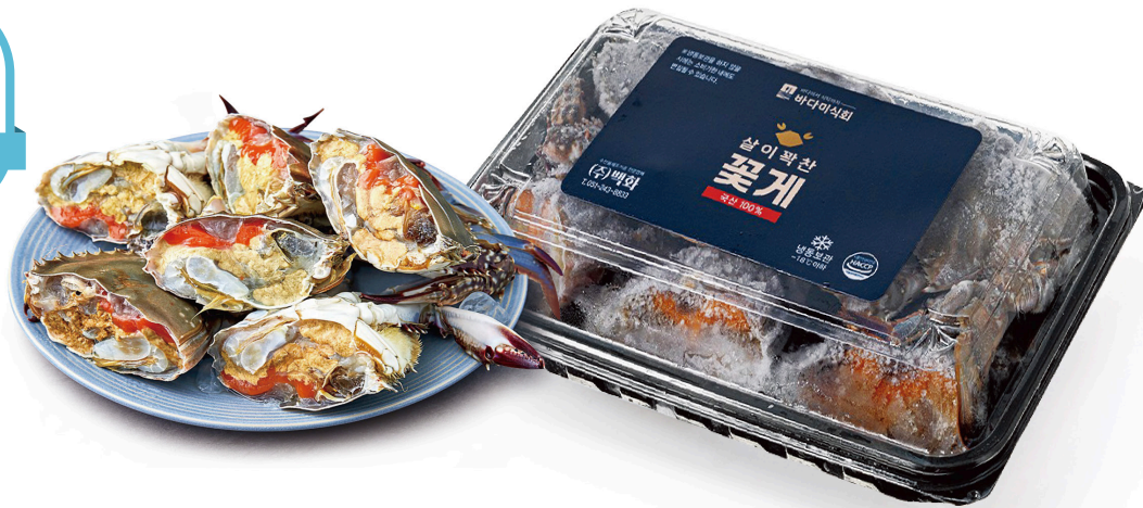
알배기 절단 2절 / Half cut (Roe-filled) (500g)