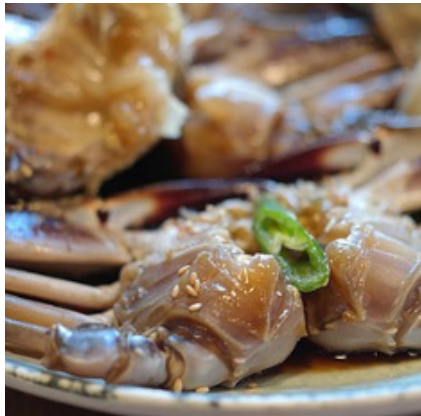
간장게장 Soy Sauce Marinated Crab