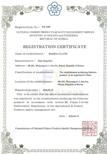
중국 공장 등록 Export to CHINA (KP-1085)