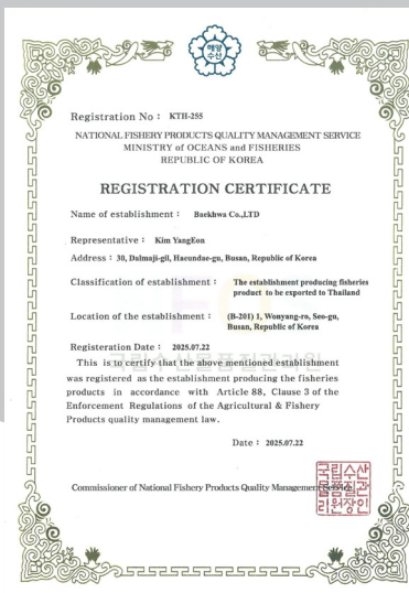
태국 공장 등록 Export to THAILAND (KTH-255)