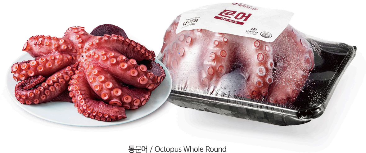
통문어 / Octopus Whole Round (800g)