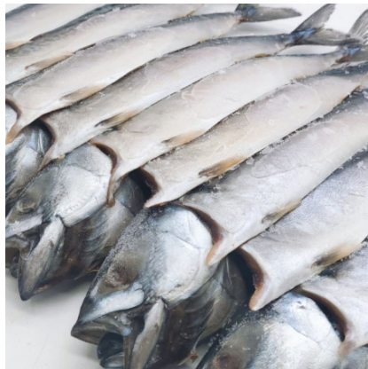
자반고등어 Salted Mackerel