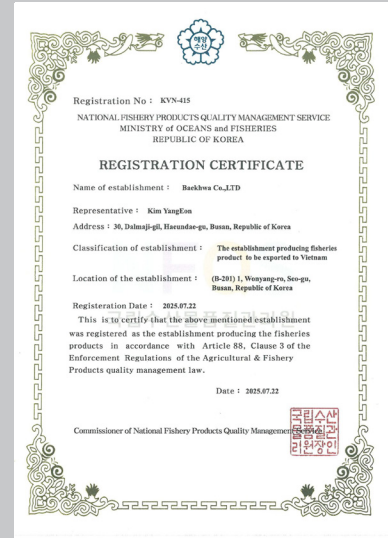
베트남 공장 등록 Export to VIETNAM (KVN-415)