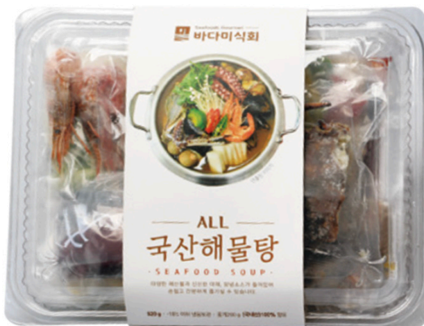
해물탕 Seafood Soup (920g)