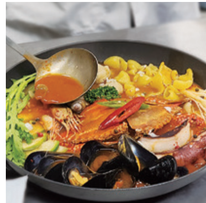
해물탕 Seafood Soup