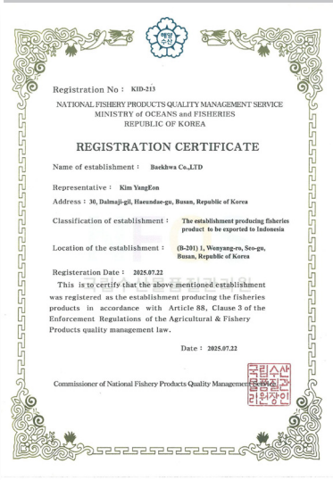
인도네시아 공장 등록 Export to INDONESIA (KID-213)