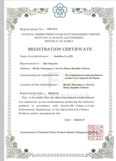
러시아 공장 등록 Export to RUSSIA (KRF-0122)