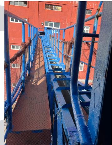
이동 Ice Conveyance