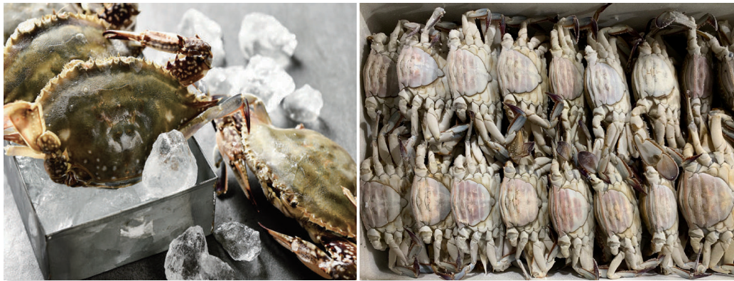
원물 / Raw Material