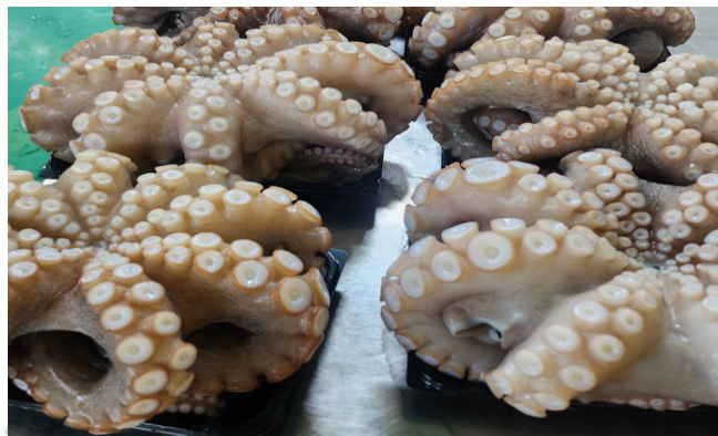
원물 / Raw Material