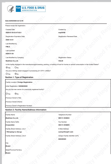
미국 FDA 가공시설 등록 Export to USA (FFR#18206823830)