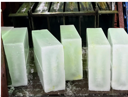
제빙(각얼음) Ice Making (Block ice)