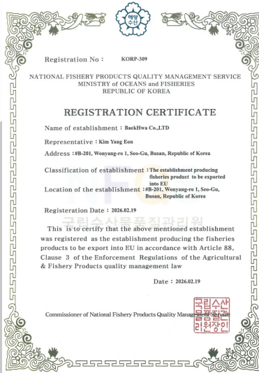
EU 공장 등록 Export to EU (KORP-309)