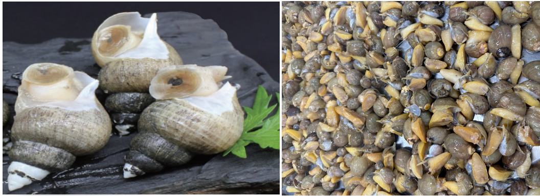
원물 / Raw Material