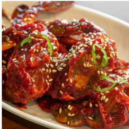
양념게장 Spicy Marinated Crab